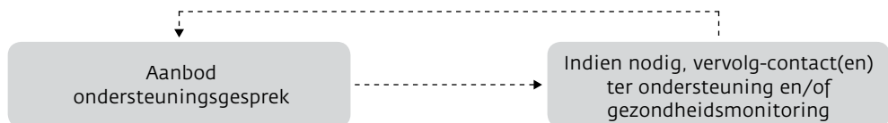
Figuur 3. Stappen binnen de georganiseerde collegiale ondersteuning

Hoewel uit box 4f veel verschillen in (landelijke) organisatie naar voren komen, kan het verloop van de collegiale ondersteuning zoals nu georganiseerd bij politie, brandweer en ambulance en Koninklijke Marechaussee beschreven worden zoals in figuur 3. Feitelijk is figuur 3 daarmee een nadere invulling van stap 3 uit figuur 2. Van belang is dat de collegiale ondersteuning snel beschikbaar is indien nodig. Dit kan bijvoorbeeld geregeld worden via piketdienst, zoals in veel organisaties al gebeurt. De benodigde hoeveelheid ondersteuners is per organisatie verschillend. Het ondersteuningsgesprek is bedoeld als ondersteuning en kan bij vervolgconsulten